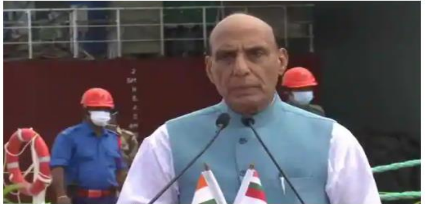
Rajnath Singh (File picture)

1 min read . Updated: 21 Nov 2021, 05:28 PM IST