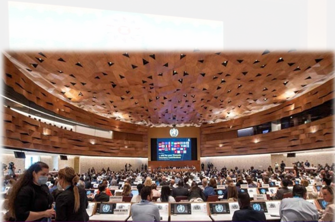
75th session of the World Health Assembly organised in Geneva