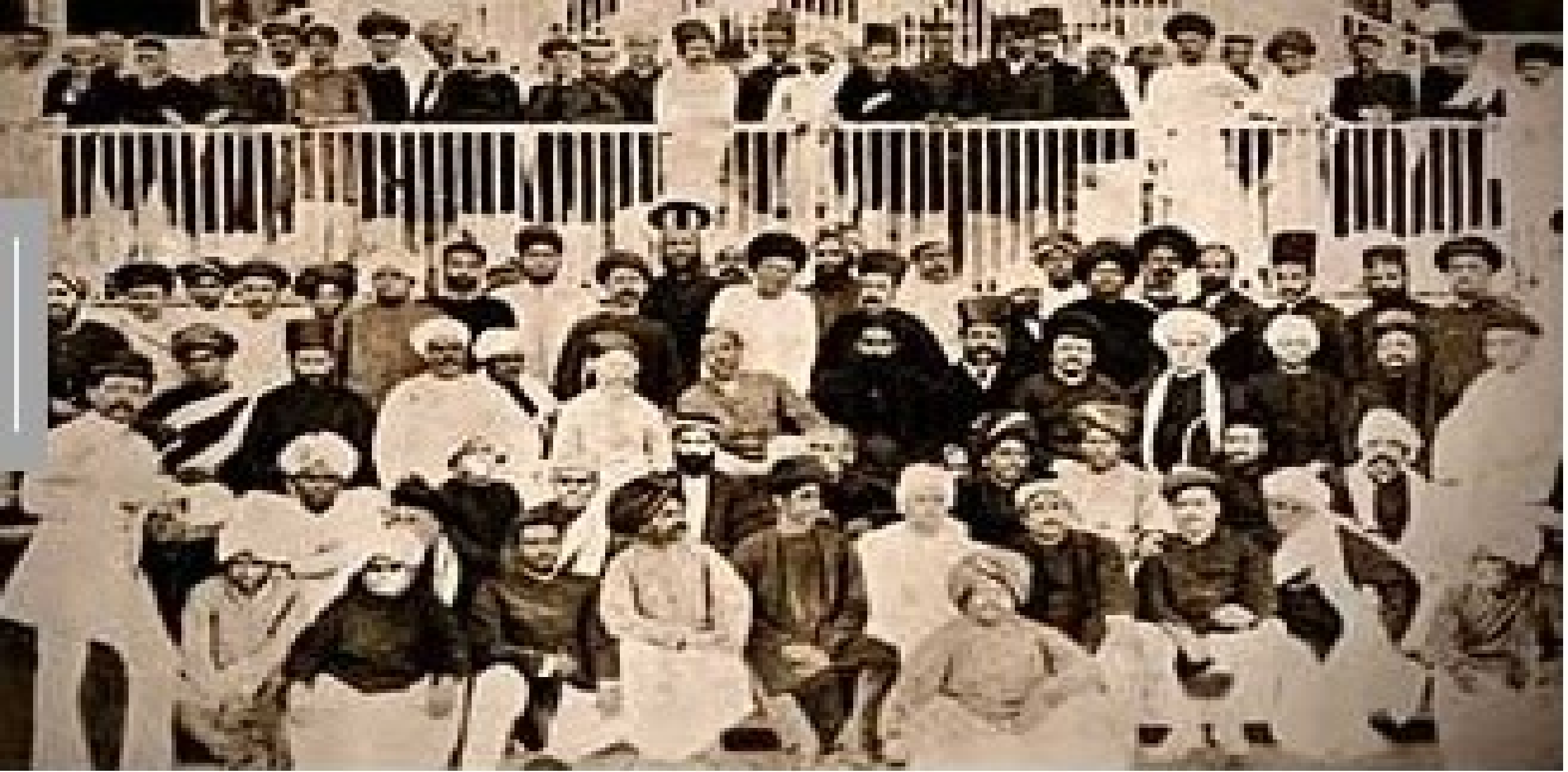
First Congress Conference - 1885