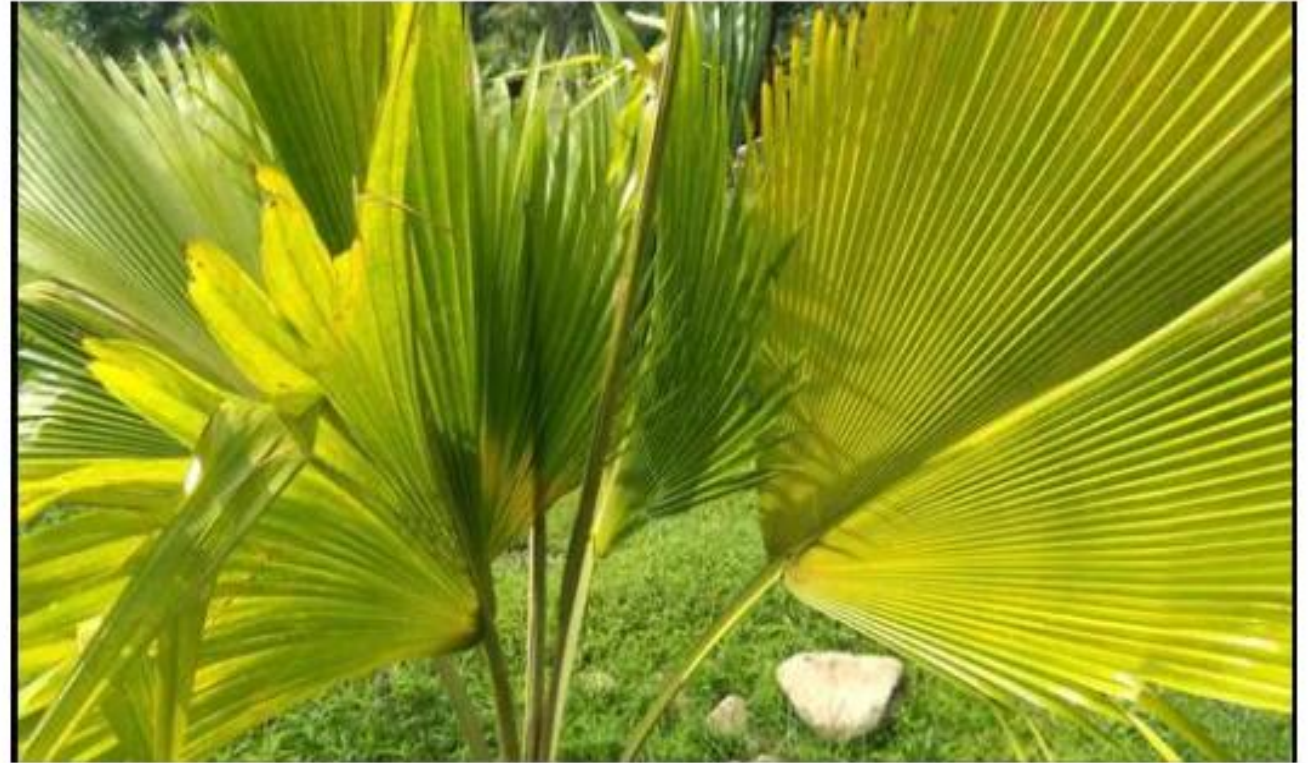
Uttarakhand Forest department's research wing on Sunday dedicated state's first Palmetum to the people of the state.

हल्द्वानी में राज्य वन विभाग के अनुसंधान विंग द्वारा उत्तराखंड का पहला और उत्तर भारत का सबसे बड़ा पामेटम विकसित किया गया है।