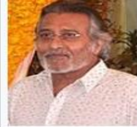
Vinod Khanna