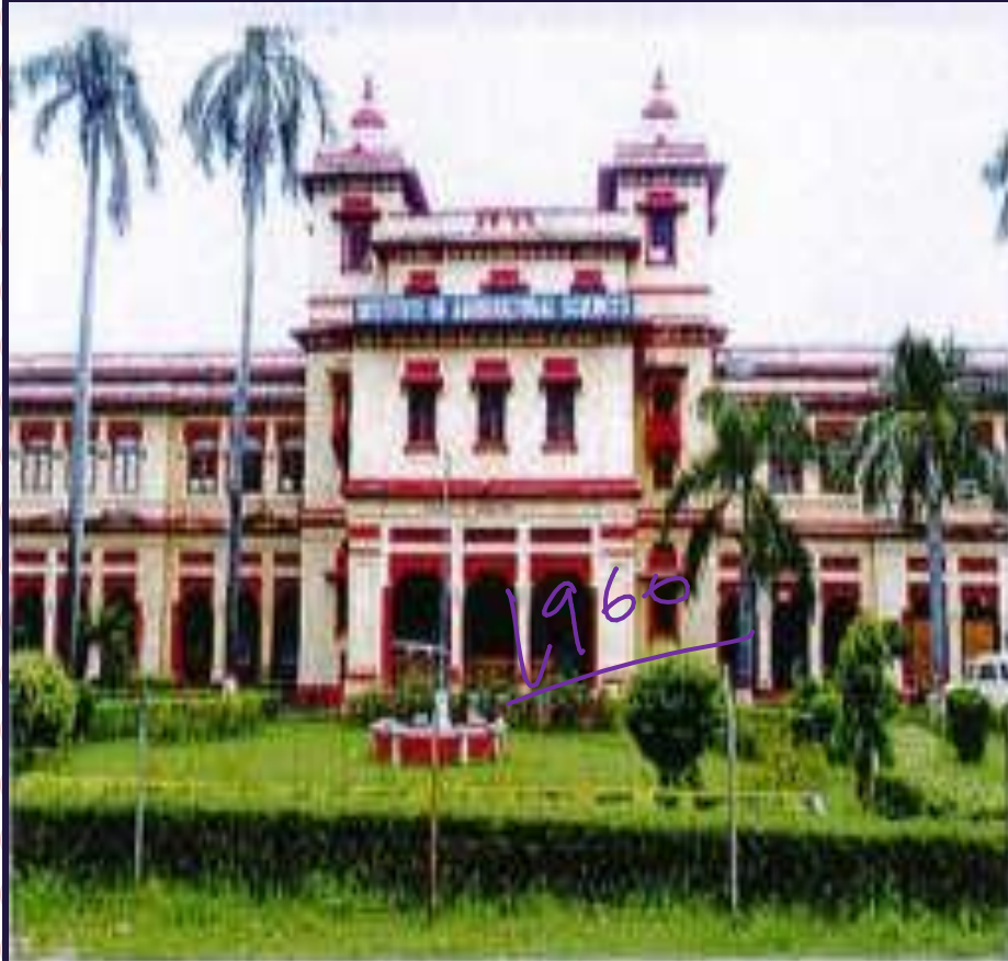
Institute of Agricultural Sciences

There were 6 Agricultural Universities established at Poona, Kanpur, Sabaur, Nagpur, Lyalpur during 1901-1905. After independence First Agricultural University was established at Pant Nagar (Uttarakhand) on the recommendation of Joint Indo-American team in 1960.