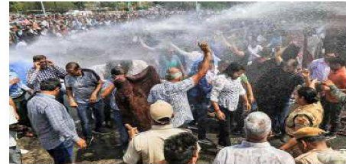
Police use water cannons in Jaipur to disperse doctors protesting against Rajasthan's Right to Health Bill which was passed by the Assembly on Tuesday.

The Bill, which was tabled in the Assembly on September 22 last year and was later referred to a Select Committee, was passed by voice vote in the House. The Bill gives every resident of the State the right to emergency treatment care "without prepayment of requisite fee or charges" by any public health institution, health