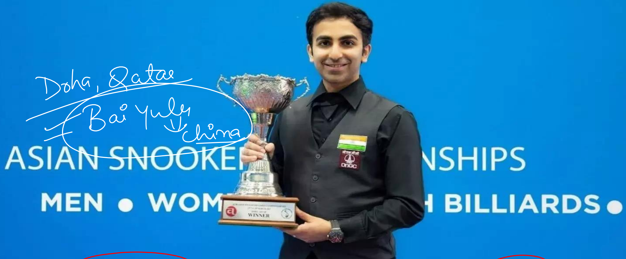
Pankaj Advani Won Asian Billiards title for 8th time