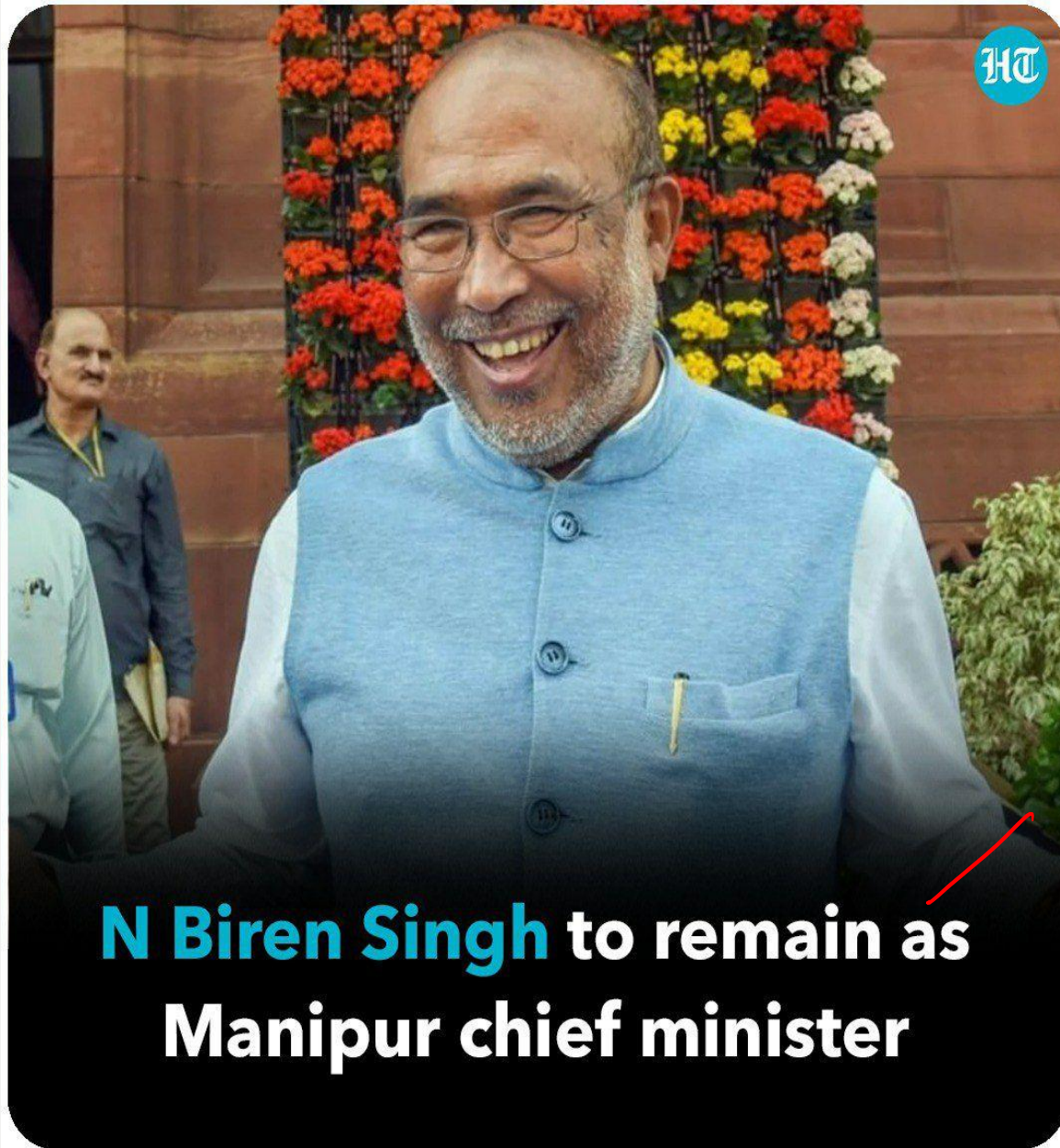
N Biren Singh to remain as Manipur chief minister