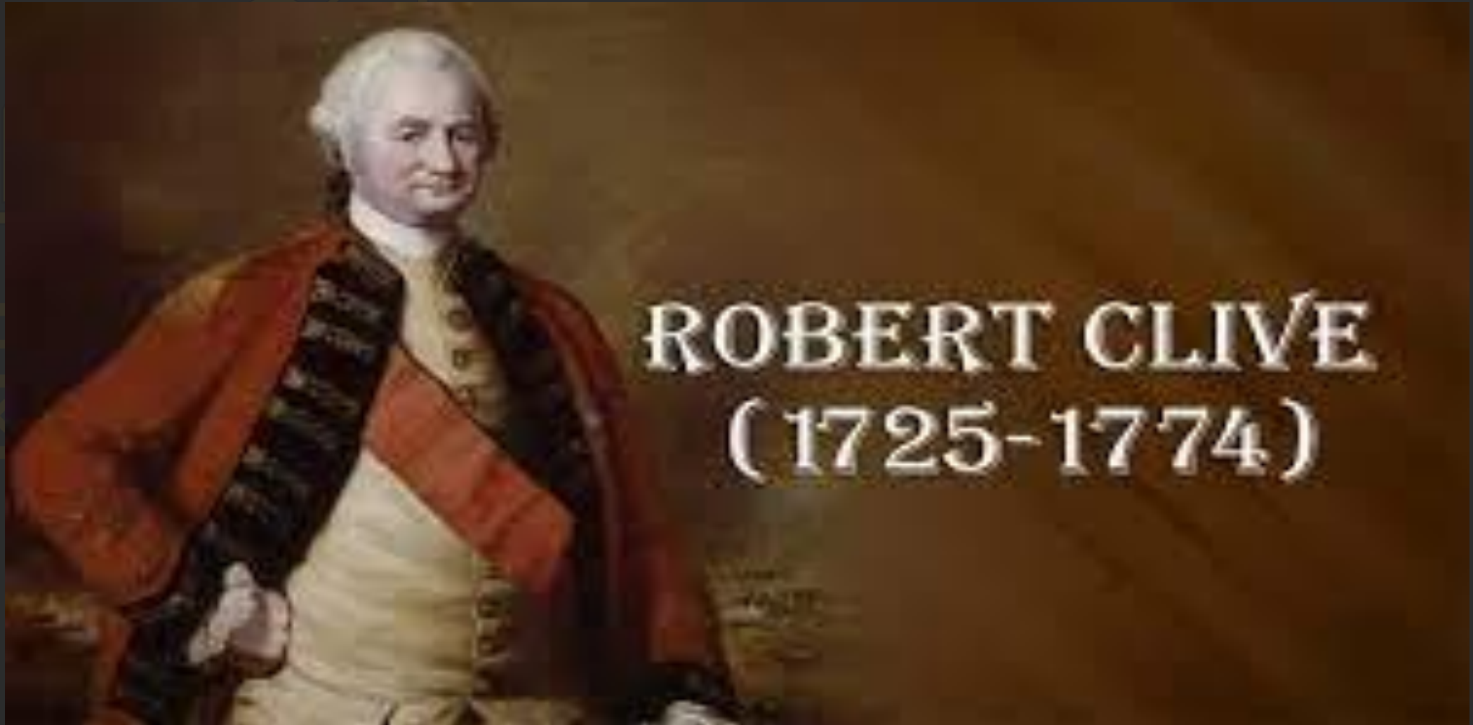
ROBERT CLIVE (1725-1774)