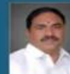
Sri Errabelli Dayakar Rao Hon'ble Minister for Panchayat Raj and Rural Development, Government Of Telangana