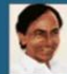
Sri K. Chandrasekhar Rao Hon'ble Chief Minister Government of Telangana