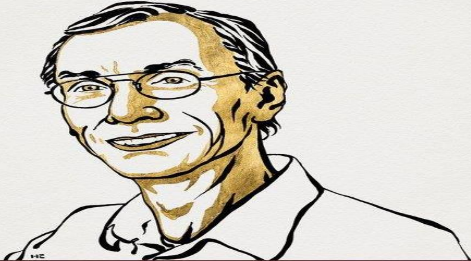
Illustration: Niklas Elmehed